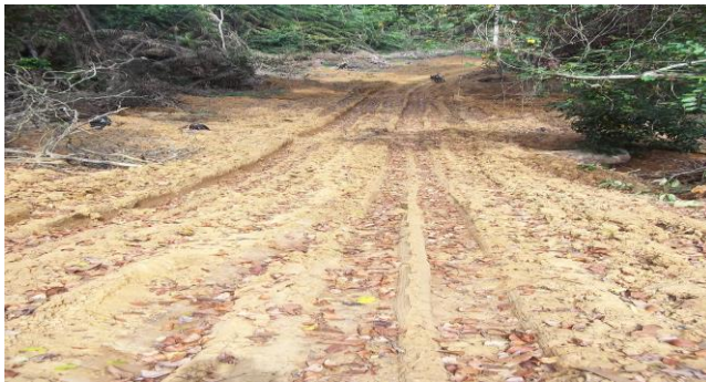
P1 : Route ouverte dans le DFN de coordonnées UTM (X : 635670 et Y : 336956)