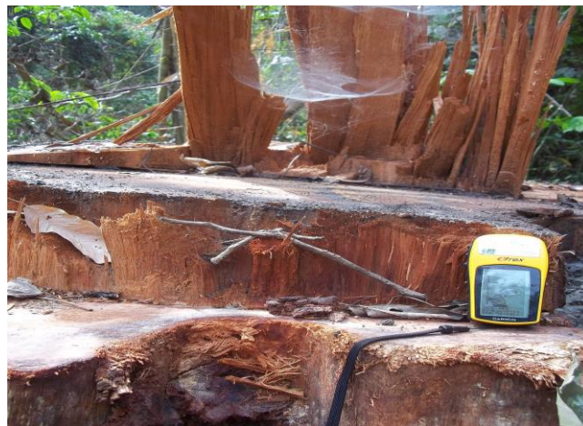
P7 : Souche de Tali Coordonnées UTM (X : 635857 Y : 337968)