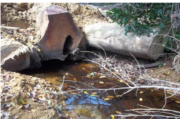
P3 : Cours d'eau obstruée de coordonnées (X : 635588 ; Y : 337913)