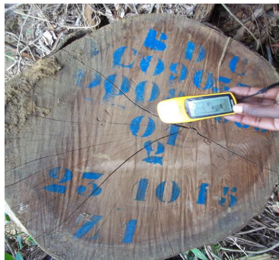
P8 : Souche d'Azobé de Coordonnées UTM (X : 635689 Y : 338140)