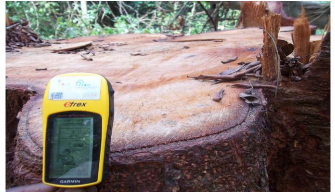
P6 : Souche de Tali Coordonnées UTM (X : 635863 Y : 337951)