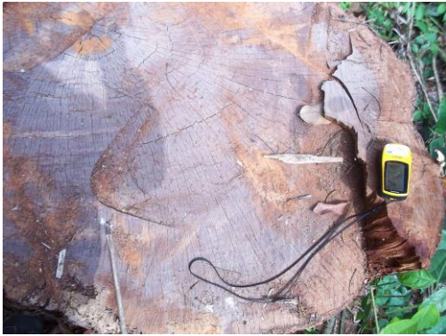
P5 : Souche d'Azobé de Coordonnées UTM (X : 635689 Y : 338140)