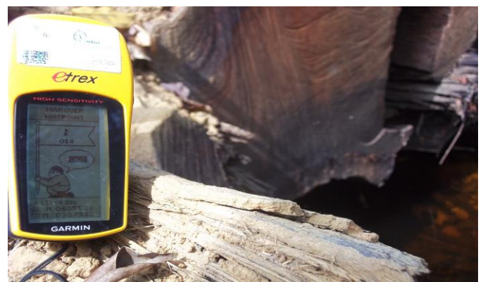
P4 : Cours d'eau obstrue de coordonnée (X: 635588 et Y: 337913)