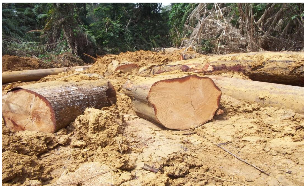
P9 : Parc à bois de Coordonnées UTM (X : 635689 Y : 338140)