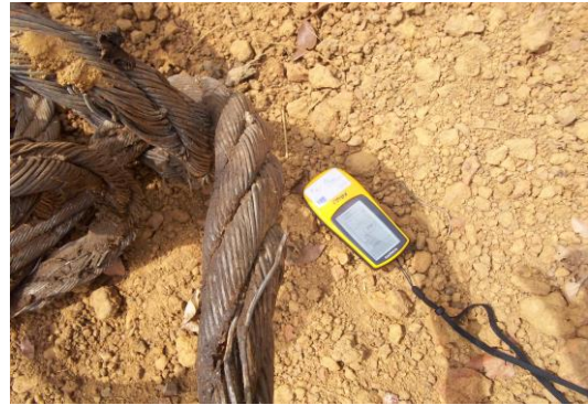
P2 : Câble de débardage abandonné sur la route de coordonnées UTM X : 635670 et Y : 336956