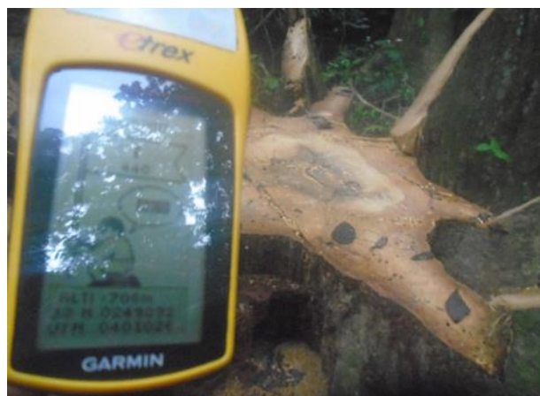
Photo 1.2 : Souche d'Ayous non marquée ; 33N X : 249 392 ; Y : 401 026