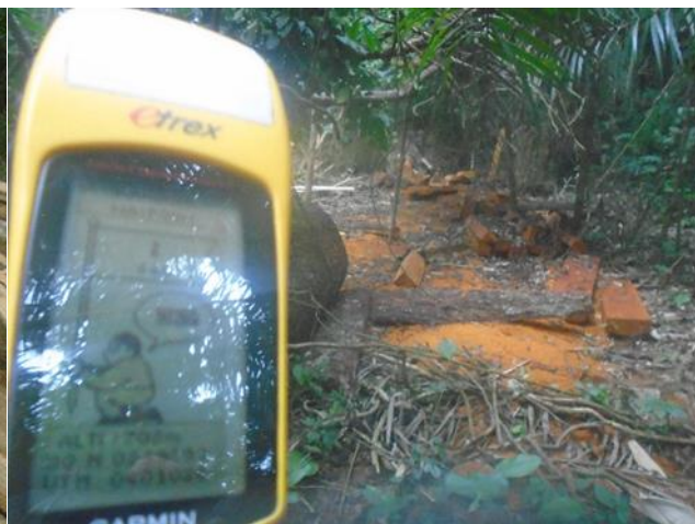
Photo 2.2 : Site de sciage des débités de Bilinga 33N X: 249 392 ; Y : 401 026