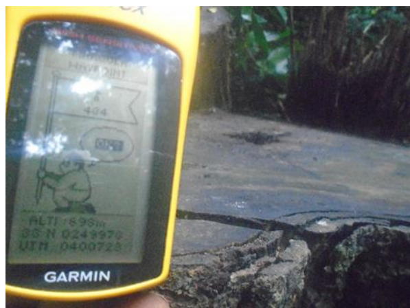
Photo 1.1 : Souche de Bilinga non marquée 33N X : 249 973 ; Y : 400 728