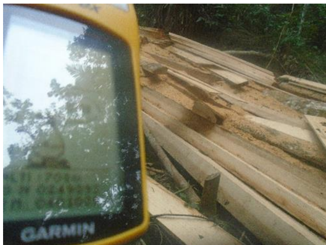
Photo 2.1: Déchets/reste de sciage des débités d'Ayous 33N X : 249 436 ; Y : 401 010