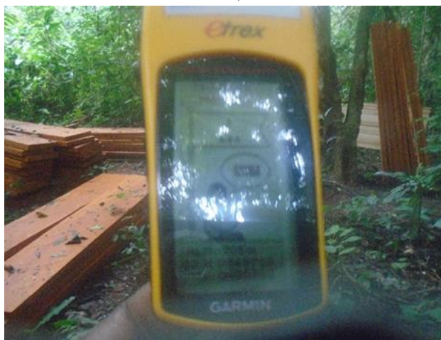
Photo 2.4 : Stock de débités de Bilinga 33N X: 249 713 ; Y: 400 889