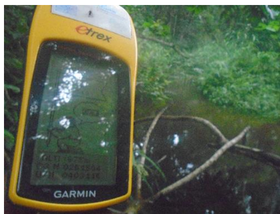
Photo 2.4 : Obstacle de la mission le cours d'eau 33N X: 251 504 ; Y: 403 114

L'équipe n'a pas pu rencontrer l'auteur présumé de cette activité pour sa version des faits et observer pendant le déroulement de la mission les camions en transit transportant les bois débités exploités illégalement.