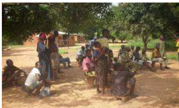
Photo 3 : Populations de Donga attentives au cours d'une réunion d'information

Les communautés de Mamgblang, Meteïng et Ngoumé souhaitent quant à elles bénéficier d'un appui à la gestion de leurs forêts communautaires et à la mise en place d'un système de commerce équitable avec leurs partenaires. En effet, la gestion des forêts communautaires semble être désastreuse dans la zone. L'illégalité plusieurs fois observée dans la gestion des forêts communautaires de Djaga a conduit à la suspension de celles-ci par le MINFOF.